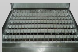
Option : caillebotis lisse (environnement humide, glissant...)

Les moyens d'accès sont déclinables en d'autres dimensions.