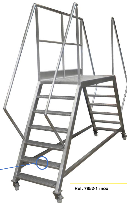
Réf. 7852-1 inox