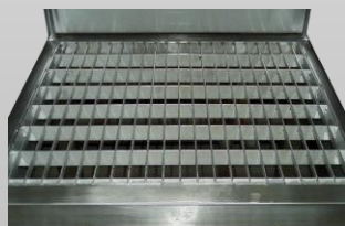
Option : caillebotis lisse (environnement humide, glissant...)

Les moyens d'accès sont déclinables en d'autres dimensions.