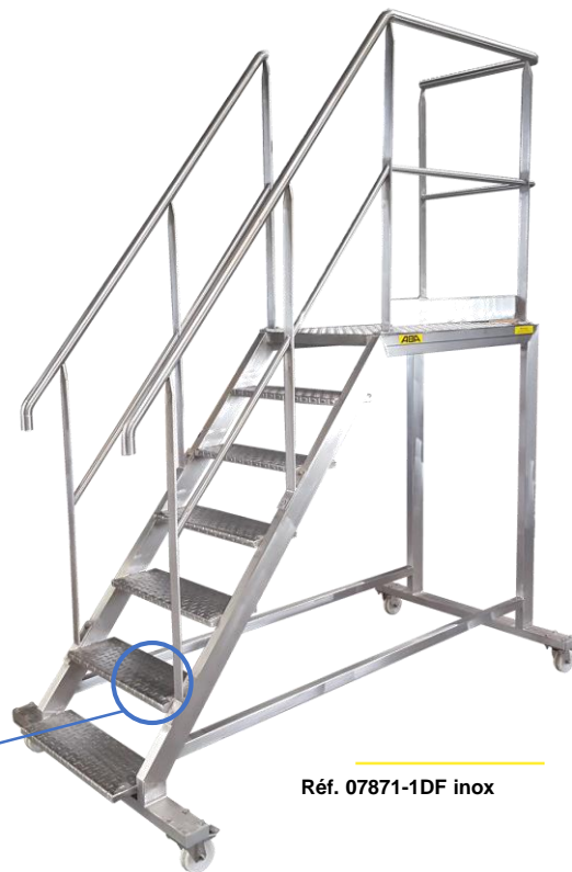
Réf. 07871-1DF inox

Appui : Sur essieux (selon hauteur de plate-forme), avec roues pivotantes à frein à l'avant (Ø 100 mm) et roues fixes à l'arrière (Ø 100 mm).